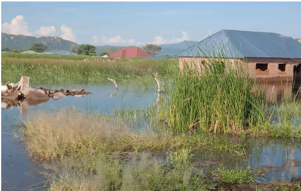
ECD in Ngalamo; langdurig slechts bereikbaar per boot.