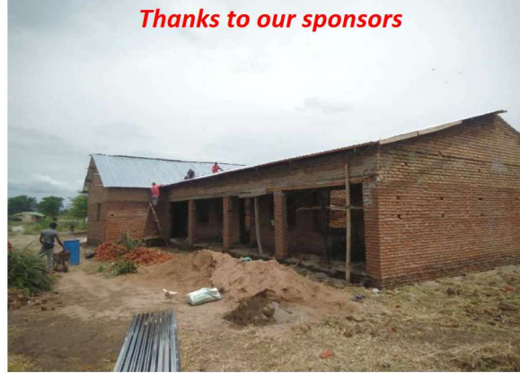
It was a mazing, a big structure was completed .it is on a high ground, it was a biggest structure in Ngalamo village. 'thanks to our sponsors'